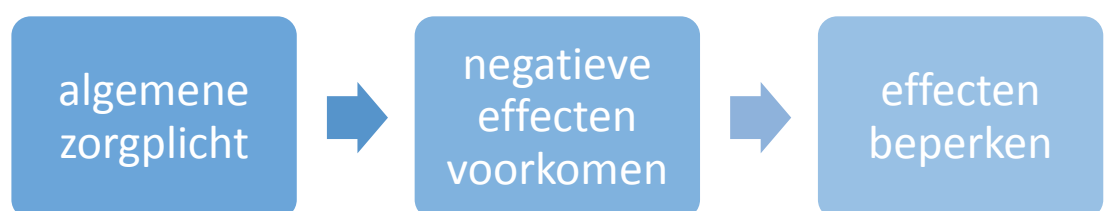
Figuur 1. Volgorde van maatregelen bij het voorkomen van schade aan beschermde planten- en diersoorten.

Uitgangspunt voor de concrete uitwerking in de voorgeschreven werkwijze is de volgende strategie: